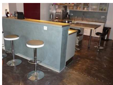
Revêtement bar Unikofloor métal « effet métal brut zinc»