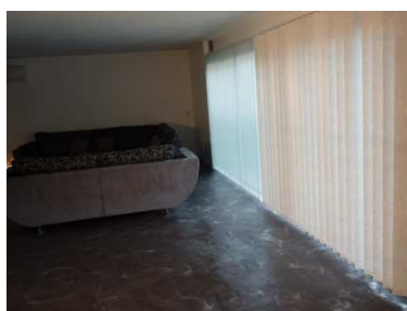
Unikofloor avec effet métallique