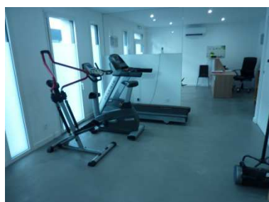
Unikoquartz dans locaux professionnels (kinésithérapie)