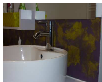
Crédence créative de salle de bain