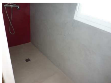
Douche avec Unikofloor (murs et receveur)