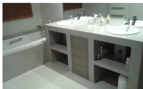
Unikofloor sur meuble, tablier de baignoire et sol